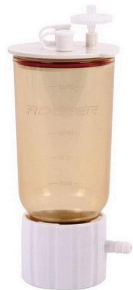
(c). 應用於 LF 3a 過濾漏斗