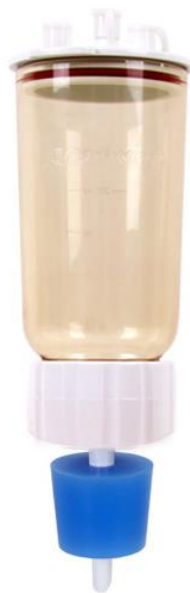
(b). 應用於 LF 3 過濾漏斗