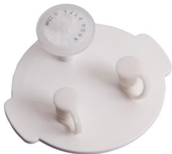
<圖 1> (a). 過濾漏斗蓋