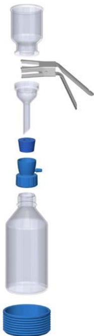
VF12 filtration set