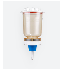
MF 5, MF 5 Pro 500 mL 磁式過濾漏斗