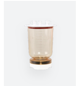
MF 5a, MF 5a Pro 500 mL 磁式過濾漏斗