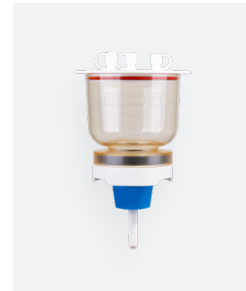
MF 3, MF 3 Pro 300 mL 磁式過濾漏斗